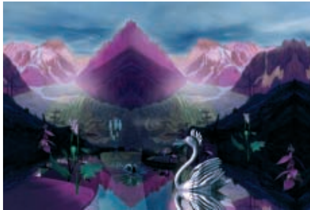
Freischwan von Steckdosen, 2004

2004: Regionale5, Kunsthalle Basel. 2003: Regionale4, FABRIKculture, Hegenheim; Freundinnen im Wohnzimmer, Tschumi, Basel; In oder zwischen zwei Welten, Kaskadenkondensator, Basel. 2001: Tummelkasten, Pavillon der Volksbühne, Berlin; Fransen und Borsten, Kunstverein Wolfenbüttel.