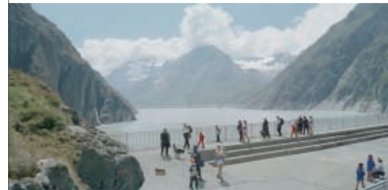
Intervalles , 2003, 50 × 103 cm, Privatsammlung

Mathieu Bernard-Reymond greift in seinen Bildwelten den Menschen im Geiste des Flaneurs als permanenten Wanderer zwischen Landschaft und Urbanität auf. Die Kontemplation der Landschaft, die zwischen Fiktion und Realität oszilliert, steht im Mittelpunkt seiner Fotografie. Mittels Rückenfiguren wird der Betrachter in die Komposition miteinbezogen. Spielerisch interveniert Bernard-Reymond im Bildaufbau und dupliziert Hintergrund, Oberfläche oder Personen. Landschaft und Staffage bleiben anonym und respektvoll distanziert zueinander.