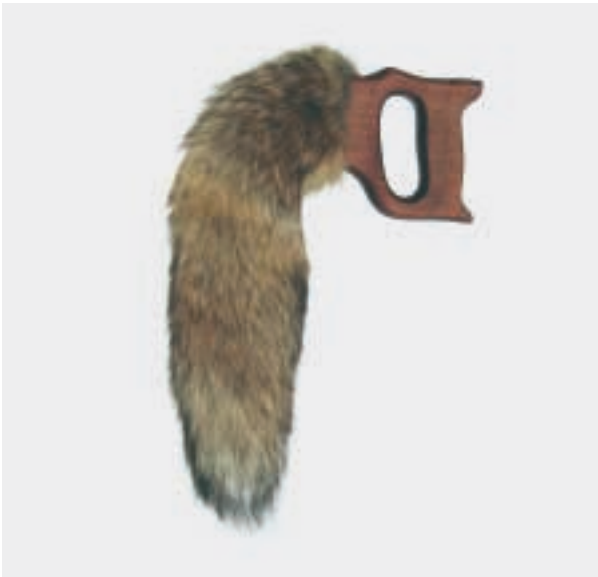
Lady, 2004, Fuchsschwanz, Sägegriff

Der Ansatz zu Isabel Schmigas Werk ist spielerisch, ironisch und kritisch. Ihre Arbeiten offenbaren immer wieder eine neue Herausforderung für den Betrachter. Kunsthistorische Zitate, Metaphern oder Wortspiele werden aufgegriffen und subtil im Werktitel kombiniert. Isabel Schmiga unverblümter und direkter Zugang zu neuen Materialien und Techniken, bis ins letzte Detail ausgelotet, schärft den Blick für erweiternde Sichtweisen und Interpretationsebenen. Die skulpturalen Objekte wie Lady und Hirschhorn üben eine komplexe Wirkung aus. Sie irritieren, indem sie gesellschaftliche Rituale entlarven. Die Reminiszenzen an Jagdreviere sind Zitate, die dem Pop und der Kunstszene entliehen werden. Durch eine neue Rekontextualisierung werden sie zu surrealen Trophäen.