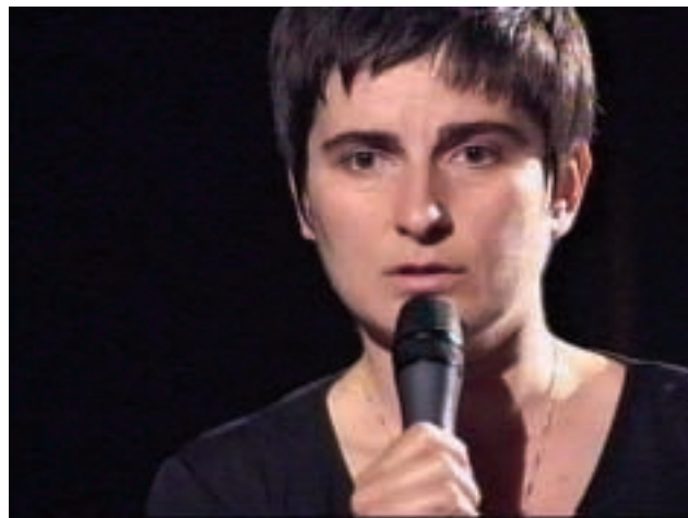
Poesie , Videostill, 2002

Studium der Kunstgeschichte in Basel, Kopenhagen und Freiburg i.Br; Nachdiplomstudium Kulturmanagement in Basel. 1997–2000 wissenschaftliche Mitarbeiterin Kunsthalle Basel. Arbeitet als freischaffende Kuratorin mit Schwerpunkt interkulturelle Projekte und themenrelevante Ausstellungsprojekte in der zeitgenössischen Kunst.