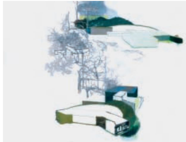
o. T., 2002, Kreide und Bleistift auf Papier, 165 x 124 cm

Karoline Walthers Bildwelten versetzen den Betrachter in eine unheimliche Stimmungslage. Die grossformatigen Zeichnungen, die skizzenartige Landschaften, urbane oder ländliche Gebäude aufzeigen, erscheinen wie ephemere kosmische Erscheinungen, welche Gedankenfragmente tagebuchartig festhalten. Die reduzierte Zeichensprache wird manchmal durch eine kolorierte Stelle hervorgehoben. Die abstrakten und figurativen Zeichenspurten von Naturelementen und von architektonischen Konstrukten verschmelzen und mutieren zu fiktiven und realen Erinnerungslandschaften.